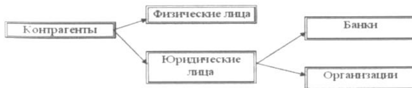
Рис. 4-1. Иерархическая структура информации о контрагентах

В группе Юридические лица откроем еще две группы Банки и Организации, в которые будем указывать конкретные банки и организации (рис. 4-1).